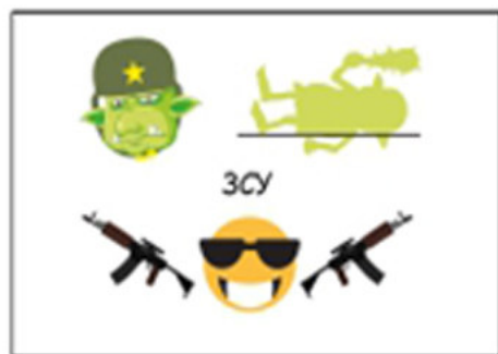
Для варіанту гри 1

На кожній картці зашифровано рядки відомих українських пісень.