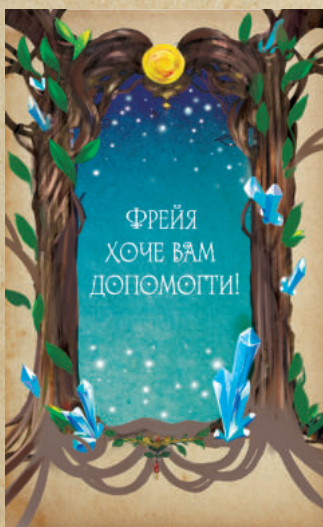
Карта порятунку Фреї

Крім питань, в кожній колоді є чарівні карти, які або допоможуть вам, або загрожуватимуть. Богиня Фрейя - рятує від відповіді. Збережіть її, і використовуйте один раз в будь-який момент протягом гри, щоб уникнути питання, залишившись на тому ж місці. І Хельга, зустрівши яку, потрібно зробити два ходи назад, щоб врятуватися від її магії (але, якщо ви перебуваєте на S, просто залишаєтеся на місці).