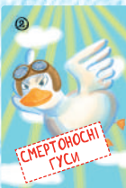
Смертносні гуси (4 шт.)