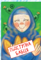
Підступна бабця (4 шт.)