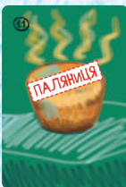
Паляниця (4 шт.)