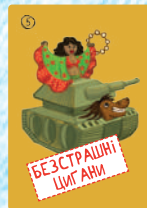
Безстрашні цигани (4 шт.)