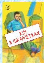
Кім в шкарпетках (4 шт.)