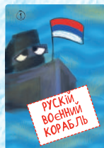
Руський воєнний корабль (4 шт.)

Комплект: 46 карток й у кожної власний номінал від 1 (найслабша) до 12 (найсильніша).