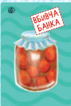
Вбивча банка (4 шт.)