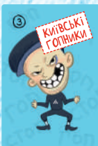
Київські гопники (4 шт.)