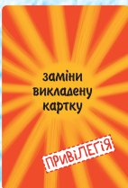
Привілегія (2 шт.)