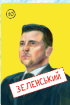
Зеленський (4 шт.)