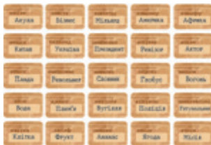
картки зі словами