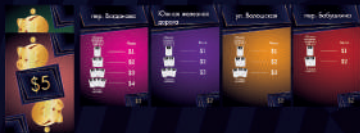
Твоя коллекция Владений