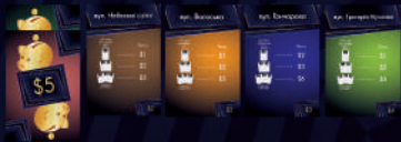
Твоя колекція Володінь